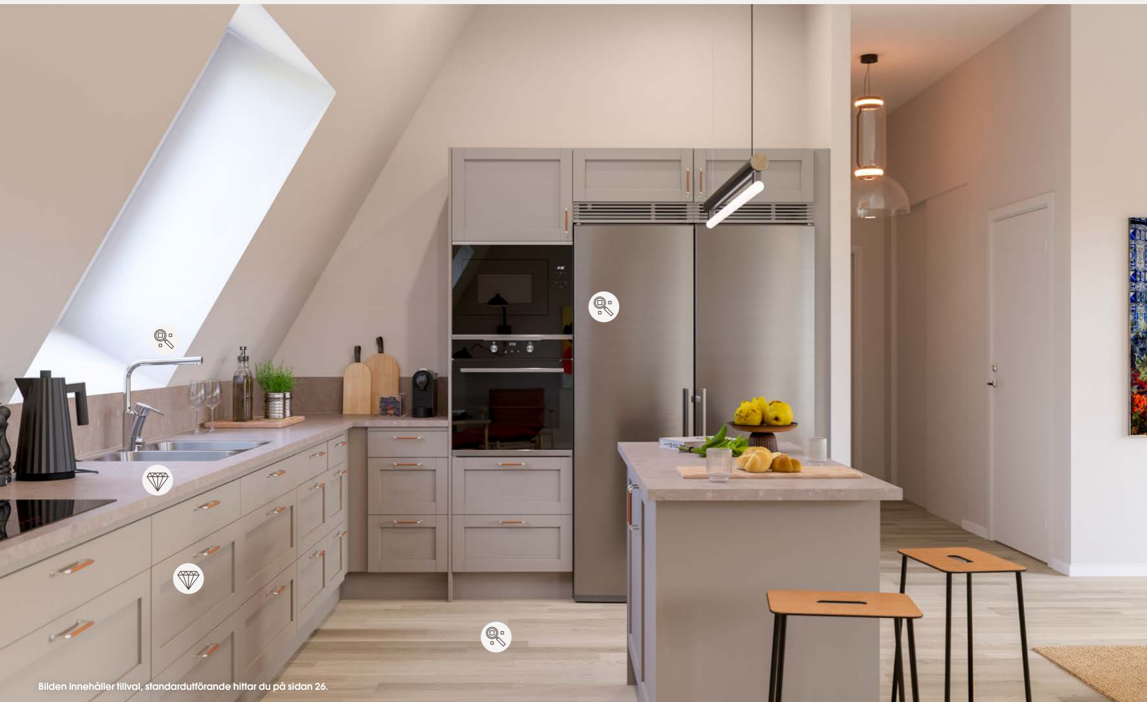
Bilden innehåller tillval, standardutförande hittar du på sidan 26.