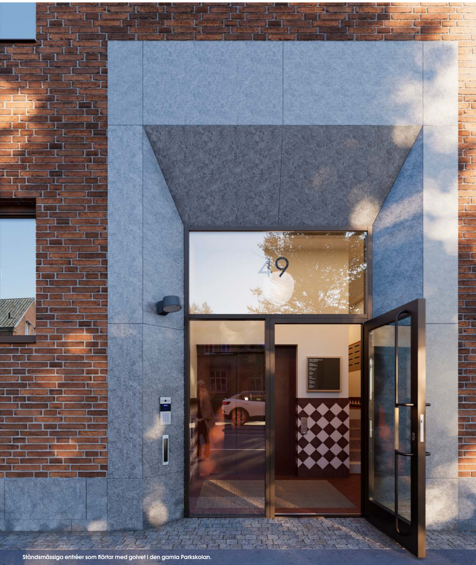
Ståndsmässiga entréer som flörtar med golvet i den gamla Parkskolan.